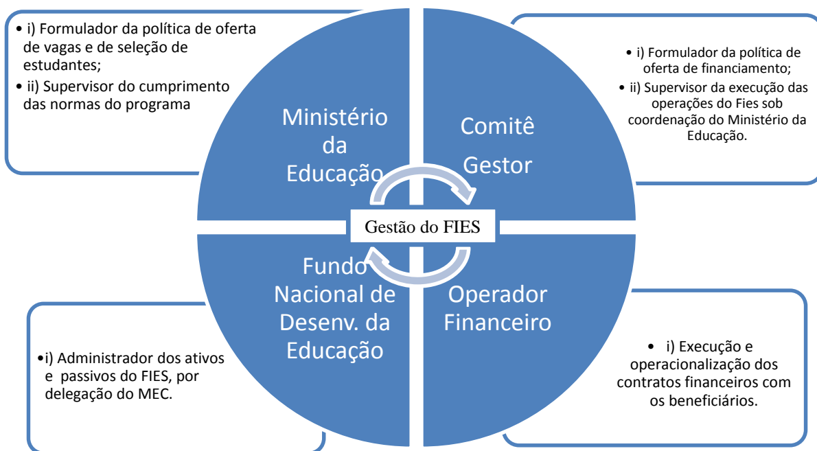
Figura 1 - Gestão do Novo FIES

interrupções na abrangência de novos estudantes. Além desses 4 atores centrais na gestão da política, destacam-se também as instituições de ensino superior (IES) e os estudantes, pois são eles quem estão na ponta da política pública. Abaixo, a figura demonstra os atores que estão envolvidos na gestão do programa e suas respectivas competências: